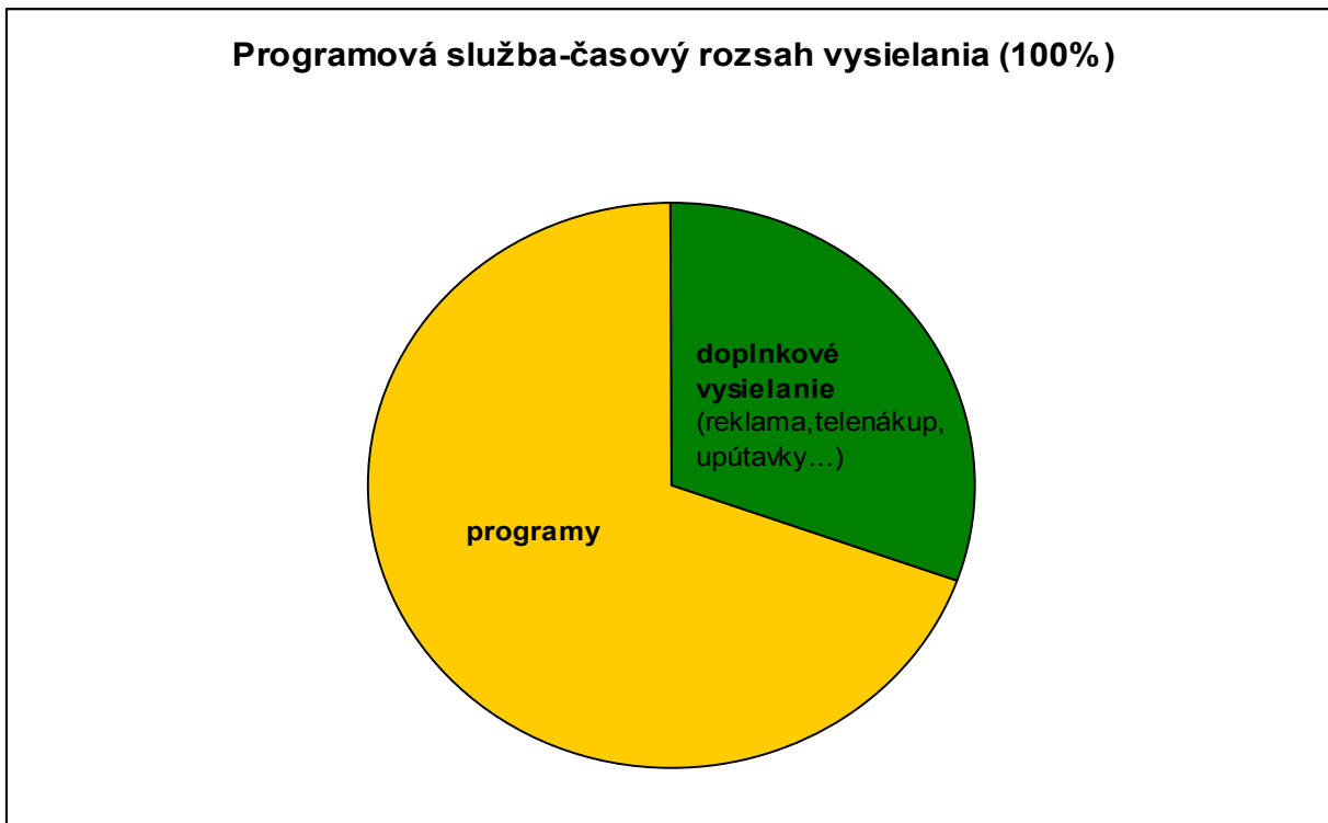
Obr.č.1 – príklad schémy časového rozsahu vysielania programovej služby § 3 písm. n) zákona č.308/2000 Z.z.